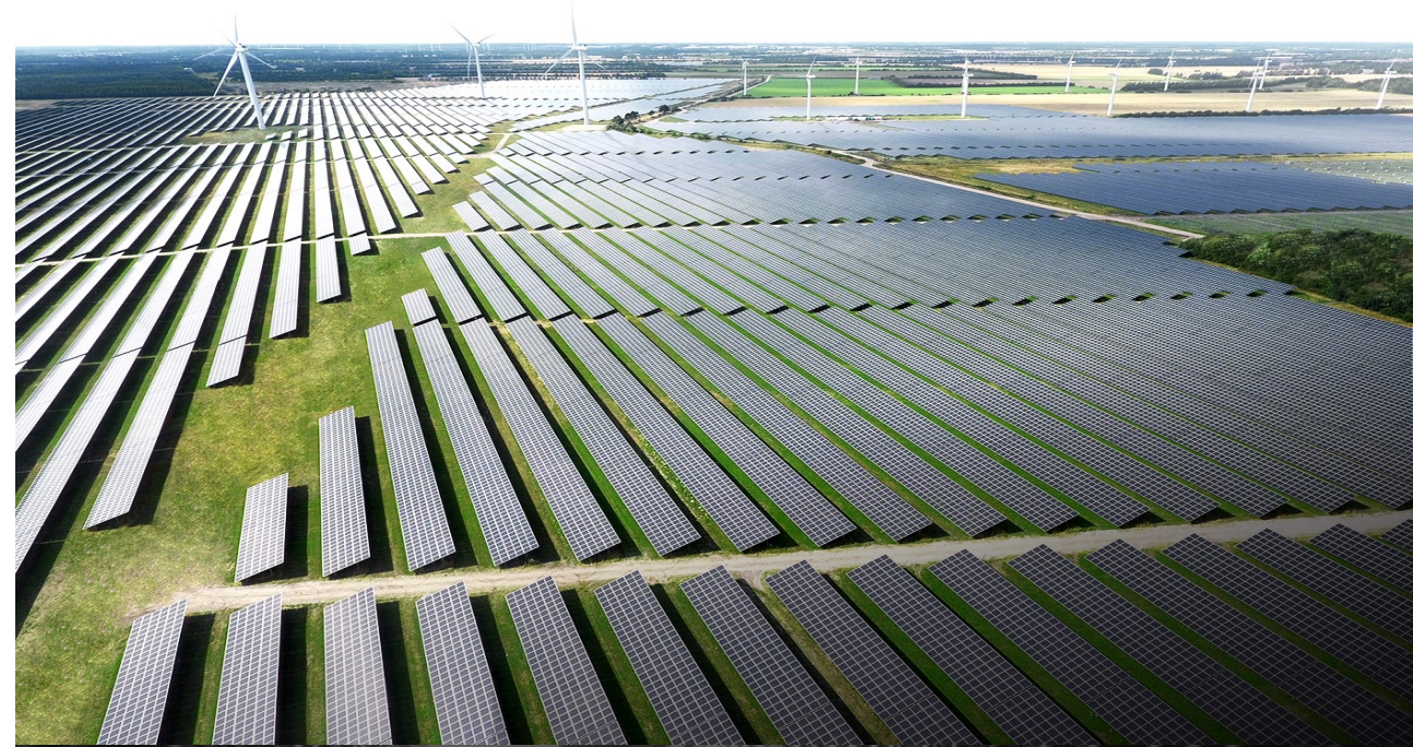
BESTSELLER Logistic Centre North (LCN)